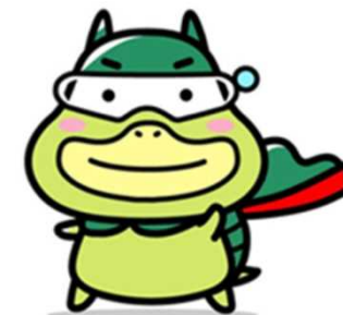
労働基準局広報キャラクター たしかめたん

全国の労働基準監督署や各都道府県にある医療勤務環境改善支援センター（勤改センター）に相談することができます。また、労働基準監督署や勤改センターでは、医療機関向けの説明会を開催していますので、そのような機会もご活用ください。