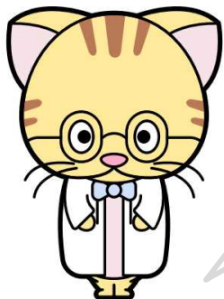
医政局広報キャラクター ドクニヤン