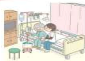
一定の医療資源を投入し、急性期を速やかに離脱