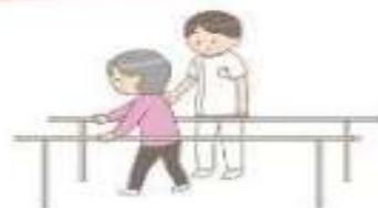
早期の退院に向け、リハビリ、栄養管理等を提供