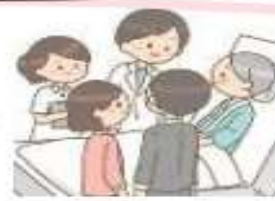
退院に向けた支援 適切な意思決定支援