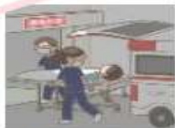
救急患者を受け入れる体制を整備