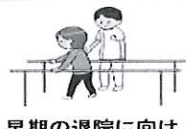
早期の退院に向け、リハビリ、栄養管理等を提供